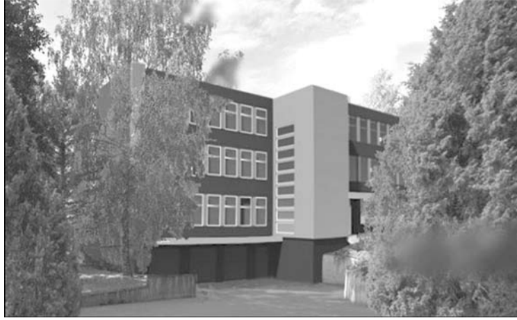
Po pastato, esančio J.Jablonskio g. 30, modernizacijos jame įsikurs kelios valstybinės įstaigos.

Pastate, esančiame J. Biliūno g. 28, Turto bankui priklauso tik atskiros patalpos, o Kęstučio g. 17 – visas pastatas. Šio turto aukcionai galėtų būti surengti ne anksčiau nei 2024 m., t.y. tik po to, kai įstaigos persikels į at-