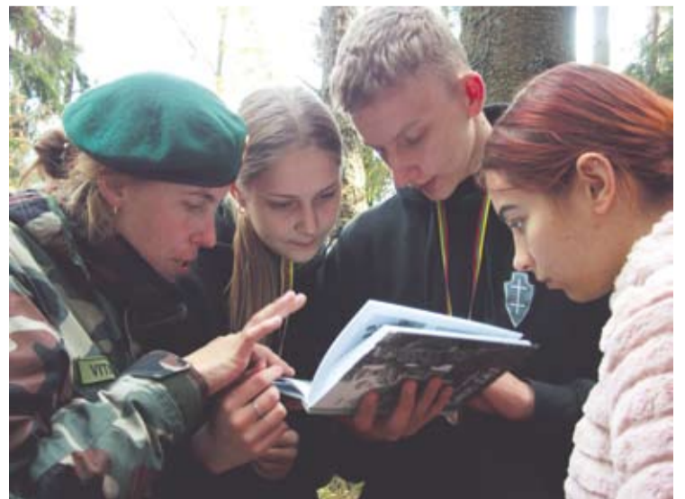
Ieškome savęs. Laisvą valandėlę knygą „Anykščių krašto šaulių istorija“ varto jaunieji Anykščių šauliai.